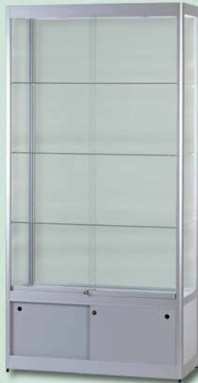
Modell 6 Standvitrine mit Unterschrank