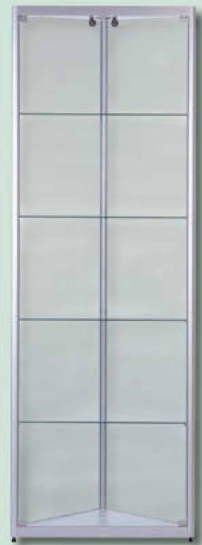
Modell 7 Eck-Standvitrine

NEU! Auch mit LED-Beleuchtung oder APOLLO-Schiene lieferbar!