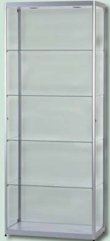
Modell 4 Standvitrine

Die Präsentations-Vitrinen für Ihren Shop oder Ihre Sammel-Leidenschaft. Alle unsere Vitrinen-Modelle liefern wir standardmäßig mit seitlichen, halbrunden Aluminiumprofilen (silber-eloxiert) und stabilen Türscharnieren . Bei dem verwendeten Glas handelt es sich um ESG-Sicherheitsglas .