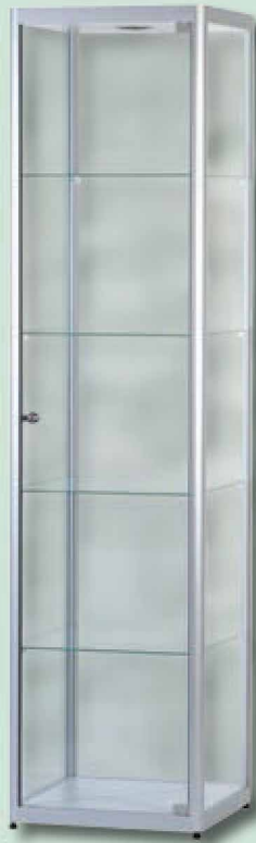
Modell 2 Standvitrine