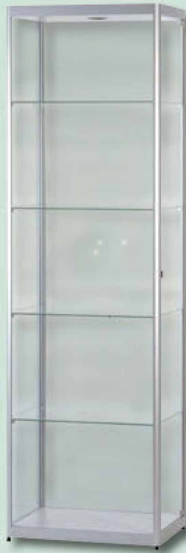
Modell 3 Standvitrine