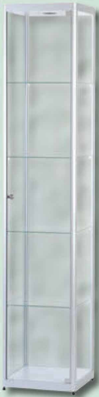
Modell 1 Standvitrine