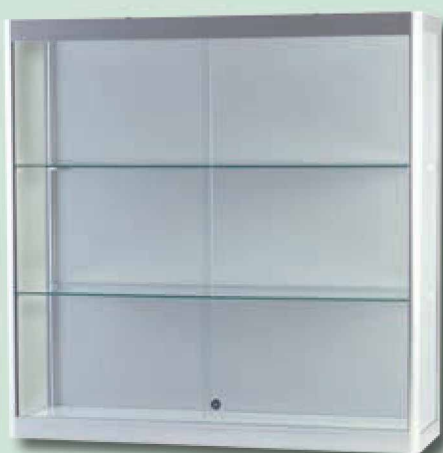
Modell 8 Wandvitrine