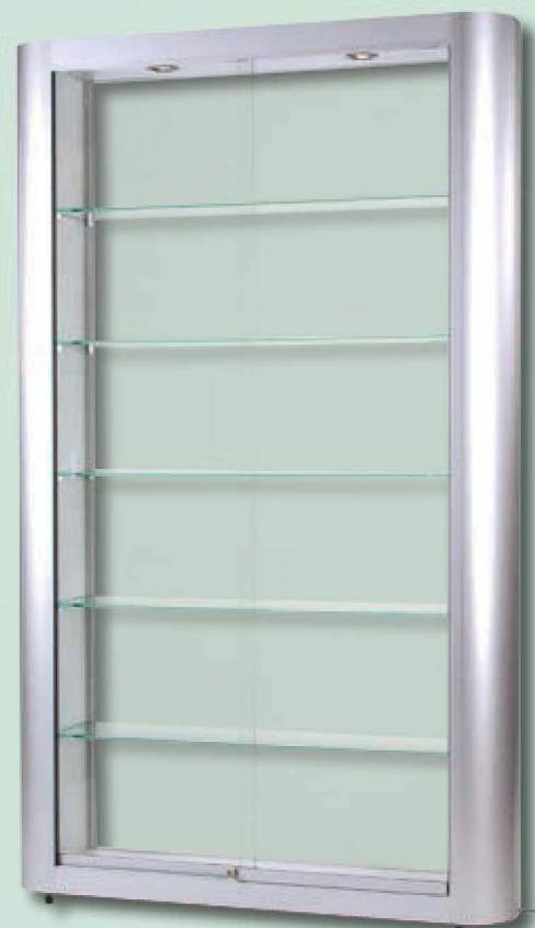
Modell 9 Standvitrine mit gewölbten Seitenprofilen

Andere Formate, Ausführungen und Farben sind bei größerer Auflage erhältlich!