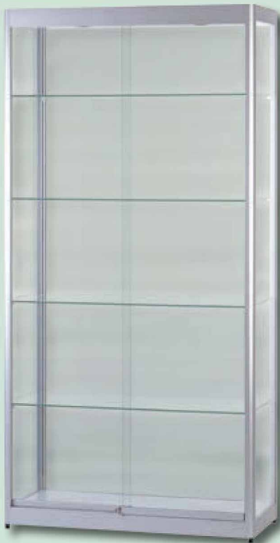
Modell 5 Standvitrine